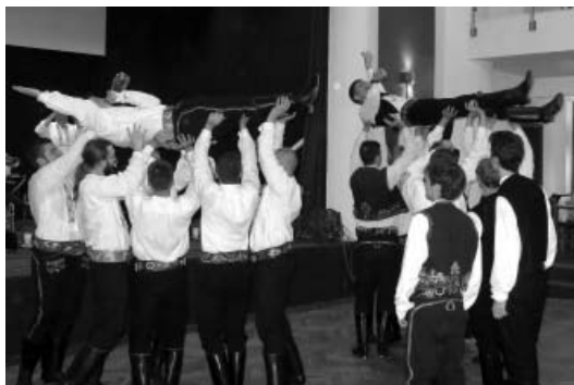
Tradiční rituál volby stárků