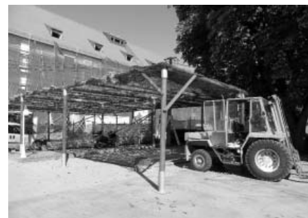
Přípravy hodovního sóla

Po hodech je v plánu zahájení rekonstrukce chodníku na ulici Zelnice, bude se pokračovat v rekonstrukci šaten na ZŠ a od poloviny září bude zahájena rekonstrukce vodovodního řadu od budovy radnice až k základní škole, na křižovatku s ulicí Hlavní. Dále bude probíhat také rekonstrukce části veřejného osvětlení, tyto práce budou provedeny firmou Havelka.