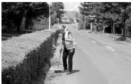
Údržba zeleně ve městě – stříhání živého plotu na ulici Nádražní.

se postarali o vyklizení tříd a zednické opravy. V srpnu byla zahájena rekonstrukce šaten na základní škole pod tělocvičnou. Několikadenní dopravní omezení v podobě úplné uzavěrky silnice si vyžádala oprava mostku přes Trkmanku u stavebnin, nedaleko vlakové zastávky. Naopak bez jakéhokoliv omezení provozu či dokonce uzavření byly provedeny zednické práce a opravy fasády budovy městské knihovny a infocentra. Budova se dočkala