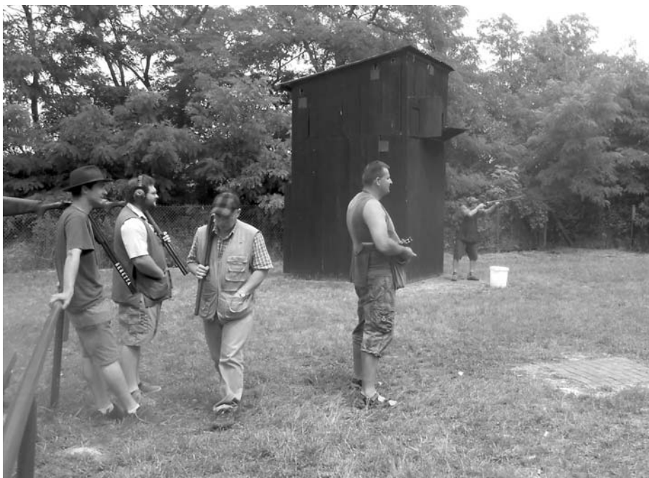
Střelby na loveckém kole O pohár města Velké Pavlovice na místní střelnici