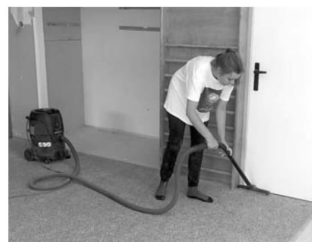
Opravy elektrických rozvodů v mateřské škole, s úklidem pomáhaly i brigádnice

Upozorňujeme návštěvníky oficiálních webových stránek města Velké Pavlovice, že v sekci Infoservis pro občany zveřejňujeme a pravidelně aktualizujeme nabídky volných míst v regionu. Infoservis najdete pod adresou www.velke-pavlovice.cz – odkaz Městský úřad – pododkaz Infoservis.