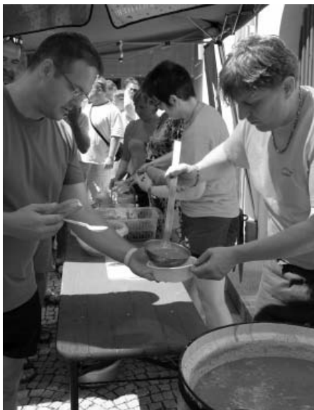
Meruňky na nekonečné množství způsobů, na slano i na sladko, vařené, pečené, smažené... a vždycky výborné!

možřejmě pozval všechny k ochutnání všech připravených specialit z meruňek. Program celého dne zajišťovalo jako partner hlavního pořadatele ekocentrum Trkmanka.