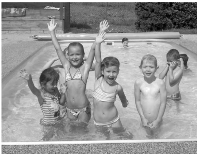
Prázdninové řádění v bazénu na zahradě školky

Konec školního roku ve velkopavlovické mateřské škole bývá ve znamení „posledního zvonění“. Tento studentský rituál je doménou maturantů, ale každoročně si jej vyzkouší i naši předškoláci. Za doprovodu svých učitelek obcházejí děti ostatní třídy MŠ včetně provozních prostor. Tuto tradici doprovází náležitý „rambajs“, smích a dobrá nálada.