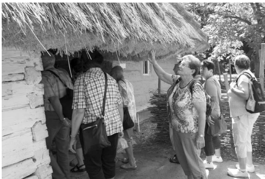
Starobylá stavení skanzenu ve Strážnici naše seniory nadchla

Po uvítání a seznámení se s programem klubu na zbytek roku se hned pustili do výborných a vonavých klobás od pana Koubka. Po jídle začala