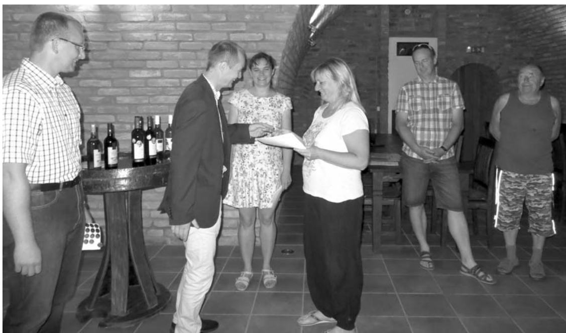
Předávání zlaté známky Slysi na vinici velkopavlovickým vinařům

Syslí populace za posledních 60 let poklesla v ČR téměř o 90 %. Sysel je ne-