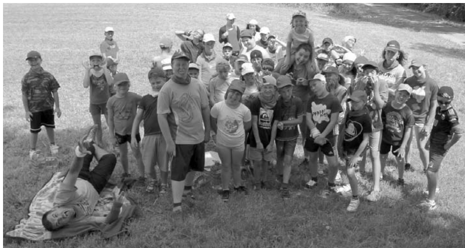
Kdousov 2016 – 1. turnus – SUPERHRDINOVÉ