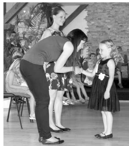
Rozloučení s předškoláky na radnici města – pasování do řad školáků

O hlavních prázdninách si většina dětí užívá plnými doušky vysněných volných dnů, chvíl pl-