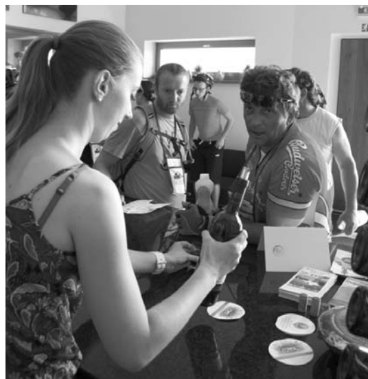
Vychlazený doušek růžového André přišel v parném počasí vhod!

Přede všemi, kteří je komplet posbírali, smekáme klobouk. V mnohdy 38 stupních Celsia ve stínu se