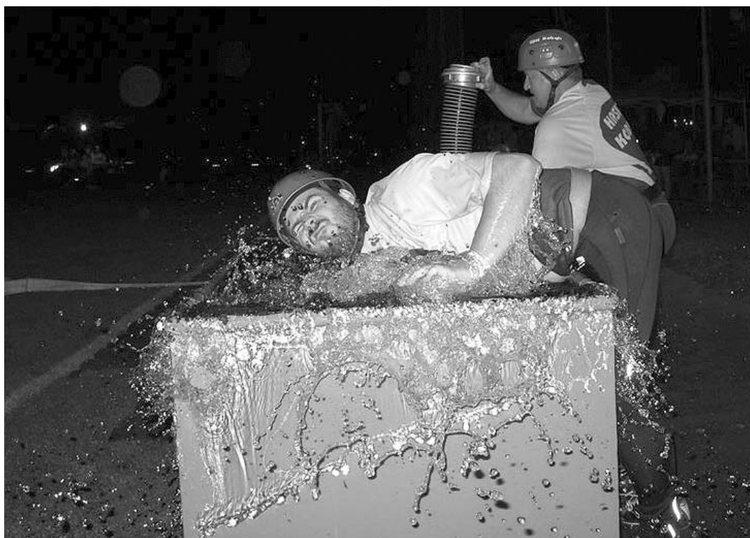
Mokrě zápolení se sníženou viditelností – to jsou velkopavlovické noční závody v požárním útoku

Z ženských družstev si nejlépe vedlo družstvo z Hovorán. Čas druhého pokusu