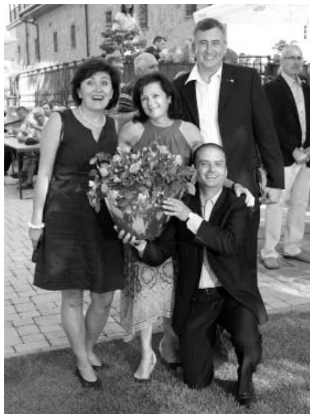
Křest nové růže s názvem Pálava na Vinařském penzionu André

Dalším významným hostem, který obdržel jako první růží Pálava včetně pamětního certifikátu, byl prezident nafurt Svobodné re-