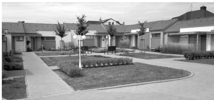
O pěkné prostředí v okolí svých bytů pečují senioři téměř sami