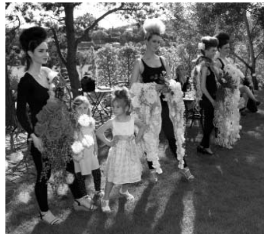
Modelky ozdobené květinami představily kvarteto odrůd révy vinné vyšlechtěné na ŠSV ve V. Pavlovicích – Agni, Aurelius, André a Pálava

Věříme, že vás budeme moci přivítat u nás a s radostí tento nový „voňavý, barevný a světově výjimečný“ zážitek ukázat.