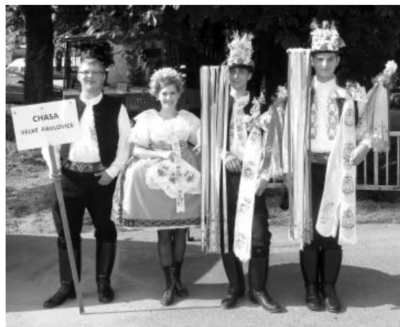
Velkopavlovická chasa na 2. setkání přátel jižní Moravy