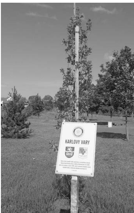
Pamětní deska připomínající výsadbu dubu k příležitosti 700. výročí narození Karla IV.