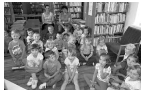
Letní návštěva dětí z mateřinky v knihovně. Tentokrát si vyrazily na výlet

Největší radost nám dospělým děti udělaly tím, že své město znají opravdu dobře. Bezpečně poznaly mezi ostatními všechny obrázky Velkých Pavlovic. Nejenom však stavby a památky, ale třeba také vlnu pestrou, květy